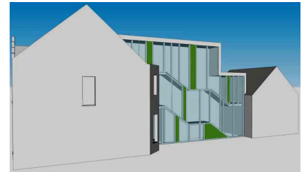
Voorstel sanitair blok

Een architectenbureau kreeg de opdracht een masterplan te maken. Dit is ondertussen gebeurd en de plannen voor fase 1 werden ingediend.